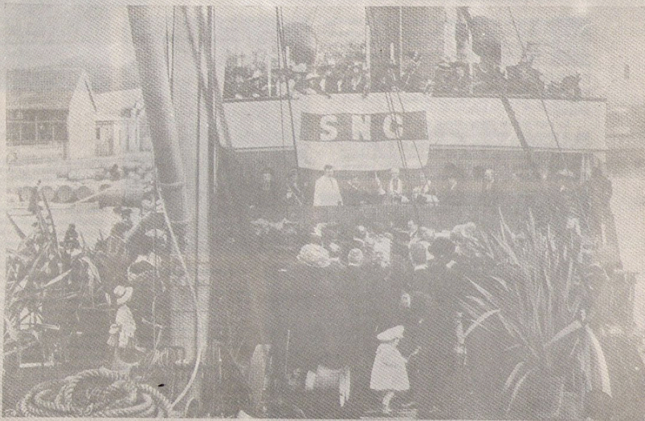
La cérémonie du Baptême: M. le Curé de Saint-Jean prononçant un discours